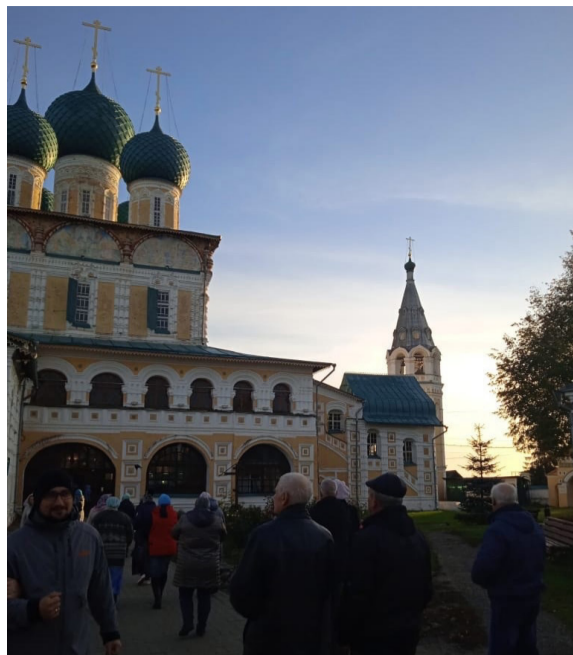
Поездки по святым местам духовно обогащают и душевно успокаивают.