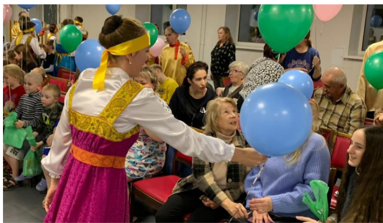
Мероприятие было организовано при поддержке Фонда Президентских грантов.

Участники проекта «АРДИ СВЕТ V ПОМОЩЬ» организовали недавно праздник для взрослых и детей - вынужденных переселенцев из ДНР и ЛНР под названием «Октябрьские посиделки». Он прошел в теплой, душевной обстановке. Все остались очень довольны.