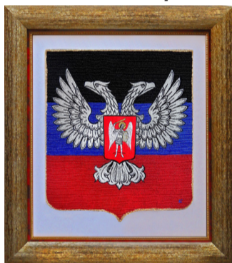
Герб Донецкой Народной Республики.