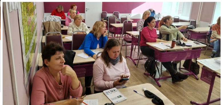
Партнер проекта Владимирский техникум экономики и права Владкоопсоюза. На занятиях со студентами-волонтерами техникума по программе «Этика взаимодействия и эффективные коммуникации с уязвимыми категориями граждан».

с инвалидностью долгое время стоять на месте без движения, потому что нужно было рассказать все полностью? И какое дружелюбие проявила дежурная по вокзалу?..