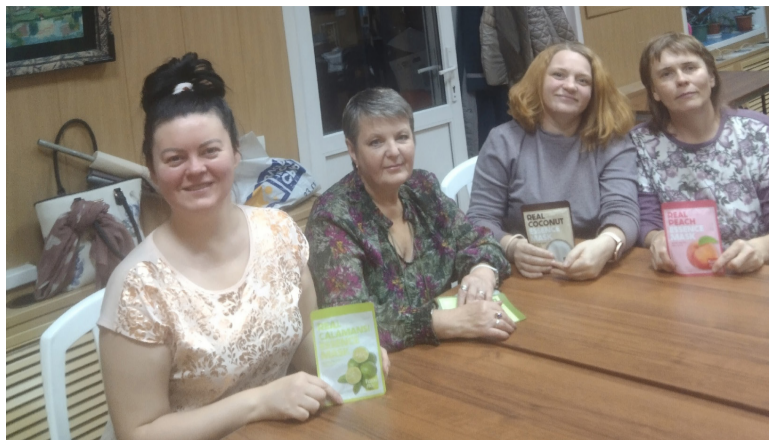
Каждая мамочка особенного ребенка получила на встрече в клубе «Лицом к лицу» небольшой подарок.