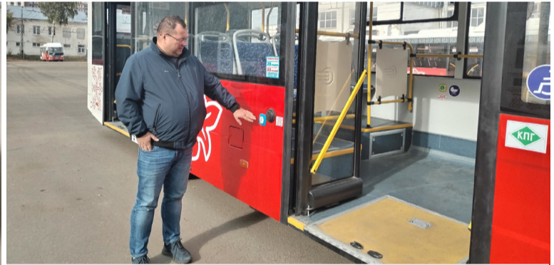
Партнер проекта АО «Владимирпассажиртранс». С интересом восприняли коллеги возможность принять участие в обучении сотрудников взаимодействию с людьми с ограниченными возможностями здоровья. На предприятии появились новые современные автобусы, которые более доступны для людей с инвалидностью. Необходимо донести до водителей, кондукторов правила деликатного экологичного взаимодействия с людьми с ОВЗ.

Было ли дружелюбное отношение у организаторов поездки? Было ли дружелюбие у экскурсовода, заставившего туристов