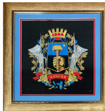
Герб города Донецка.

У нее много званий - член международной Федерации художников, лауреат премии им. Н. Островского, член Союза журналистов России... Ее имя внесено в книги «Лучшие люди России», «Гордость земли Владимирской». Созданная ей студия «Мир красоты», которой она руководила более 10 лет во