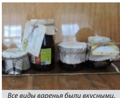
Все виды варенья были вкусными.

Члены Гороховцевской районной организации ВООО ВОИ приняли участие в познавательной программе «День варенья – праздник вдохновения!» в рамках клуба «Кудесница».