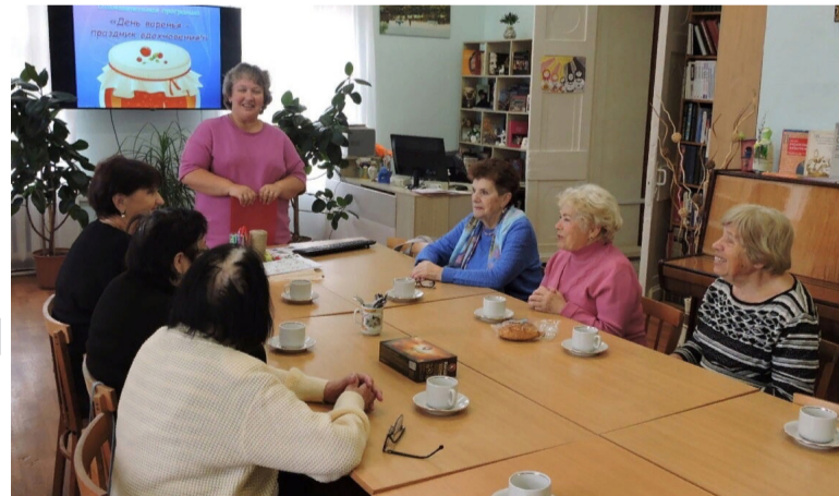
День варенья всем понравился.

Участникам программы рассказали массу интересного о любимом лакомстве: какие сладости предпочитал царь Иван Грозный, царица Екатерина II.