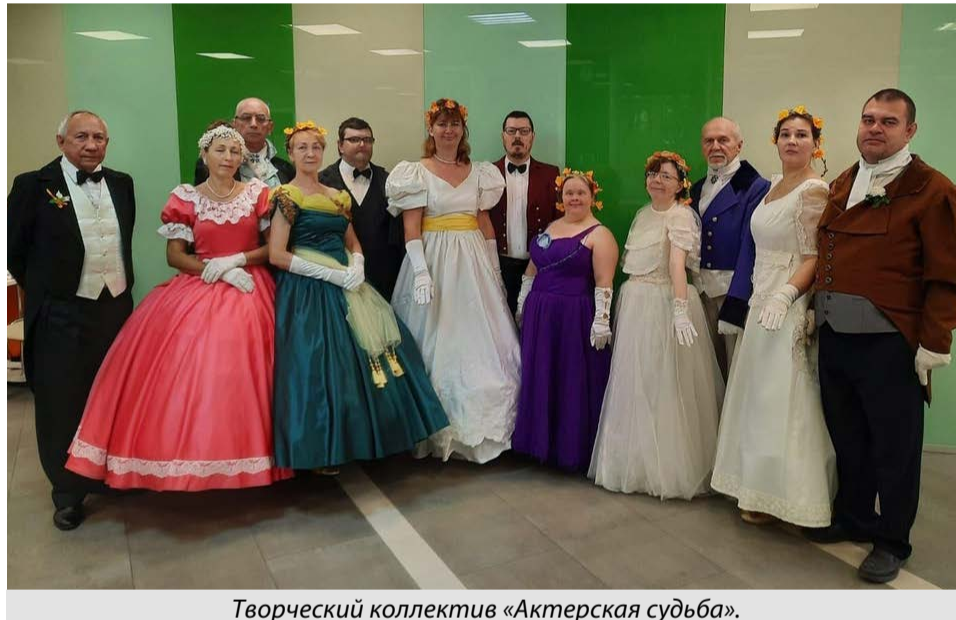
Творческий коллектив «Актерская судьба».