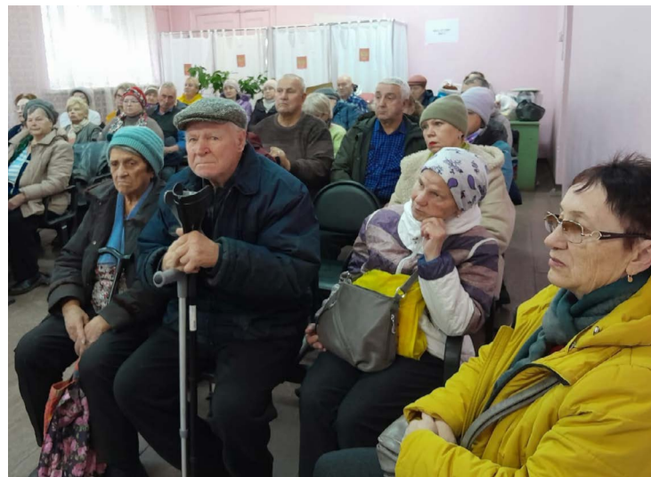
Участники встречи с сотрудниками научно-клинического центра им. Н.И. Пирогова.