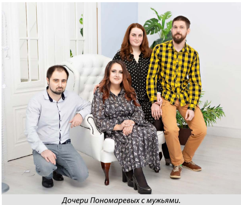
Дочери Пономаревых с мужьями.

После декрета мне предложили работать в детской школе искусств в Юрьевце. Через пару месяцев стала заведующей художественным отделением. Всегда везло с ро-