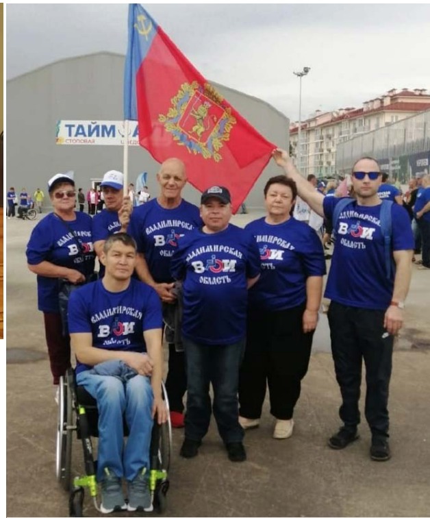
Делегация из Владимирской области на фестивале «Сочи-2022».

Развитие физкультуры и спорта осуществлялось совместно с отделением Российского спортивного сою-