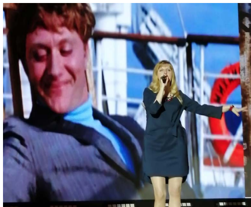
Пели песни из кинофильмов Леонида Гайдая.

В рамках этого праздничного мероприятия нашлось время и для обсуждения рабочих вопросов, поэтому решено было провести заседание правления общества. Большой интерес вызвал также просмотр фильма об областном социально-просветительском форуме, который прошел в ноябре 2022 года для актива ВООО ВОИ.