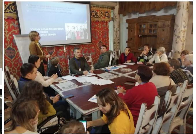
Занятие на одной из тематических площадок областного социально-просветительского форума во Владимире.