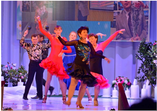
На фестивале «Моя семья» Муромского городского общества инвалидов.

Например, творчеством инвалидов Юрьев-Польская организация занимается постоянно. Работают творческие объединения в Федоровской первичной организации при доме культуры. Руководитель – работник ДК, выступления этой группы проходят по всем красным датам в городе и в населенных пунктах. Также при ДК села Горки работает клуб «Вера» с участниками художественной самодеятельности.