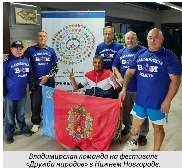
Владимирская команда на фестивале «Дружба народов» в Нижнем Новгороде.

за инвалидов (РССИ) и отделением Общероссийской общественной организации «Федерация настольных спортивных игр». Также партнером ВООО ВОИ является Федерация спорта лиц с поражением опорно-двигательного аппарата Владимирской области.