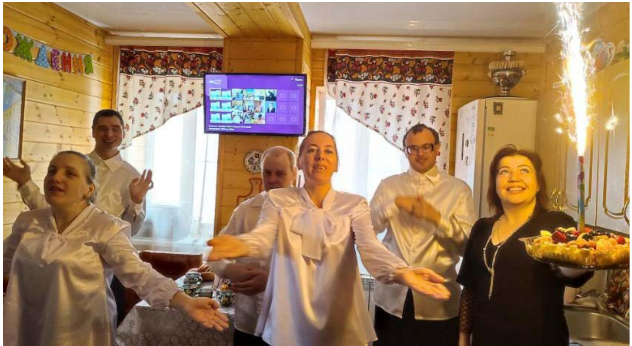
На дне рождения «Учебной квартиры сопровождаемого проживания» в Суздале.