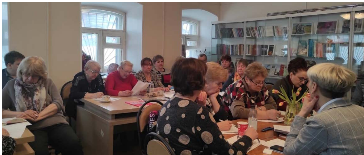
На заседании Правления ВООО ВОИ, в котором приняли участие руководители местных организаций.