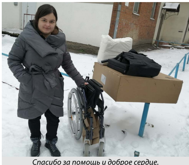
Спасибо за помощь и доброе сердце.