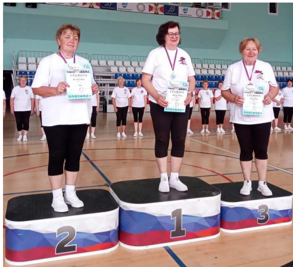
На женской спартакиаде в Александрове.

Ко Дню России местные организации ВООО ВОИ приурочили целый ряд мероприятий, которые посвятили этому празднику.