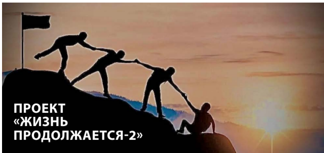
ПРОЕКТ «ЖИЗНЬ ПРОДОЛЖАЕТСЯ-2»