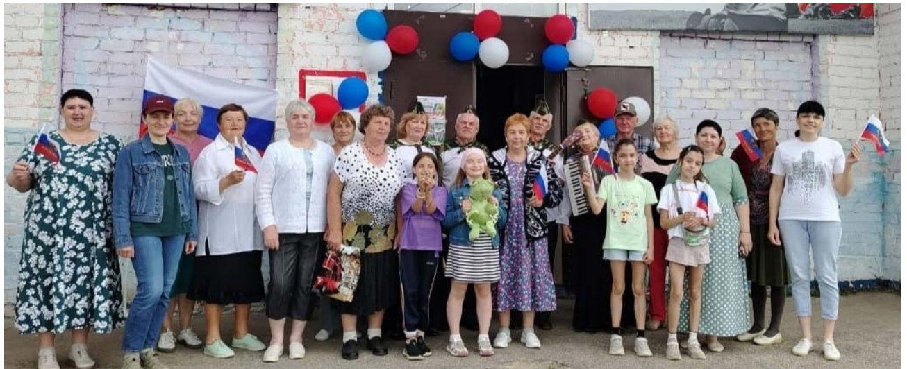
Участники торжественного мероприятия, посвященного Дню России в Камешковском районе.

Александровская организация приняла участие в женской спартакиаде для людей старшего возраста, которая проходила в ФОКе «Олимп» в честь Дня России. Организация представила пять спортсменок. Они состязались в стрельбе, плавании, метании дротиков, в скандинавской ходьбе. Спартакиада прошла в торжественной обстановке, спортсменов приветствовали руководители Александровского района и отдела соцзащиты, которые поздравили всех с Днем России. Соперничество уступило место товариществу, духу единства.