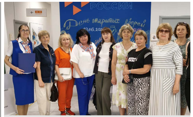
На дне открытых дверей в Кадровом центре «Вязниковский».