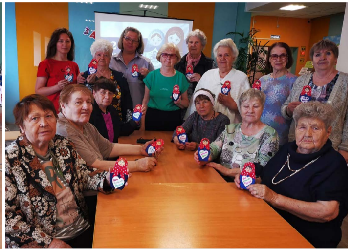
Участницы творческой мастерской по изготовлению матрешек в Судогде.