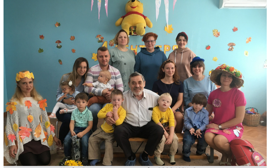
На одной из инклюзивных площадок ВООО АРДИ «Свет».

Владимирская область будет входить в стратегическую программу Уполномоченного по правам ребенка при Президенте РФ.