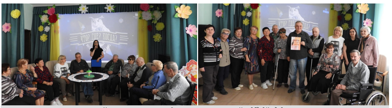
Участники товарищеской встречи в рамках игры «Что? Где? Когда?».