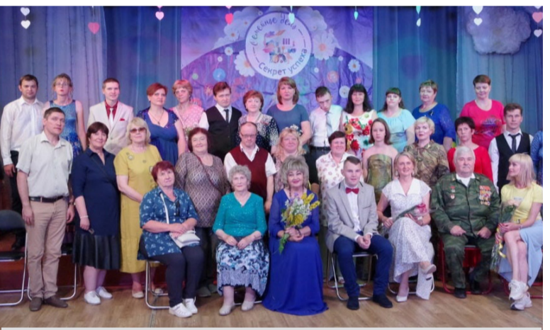
Фотография на память. Активисты общества инвалидов из Вязников с членами Муромской окружной организации инвалидов.