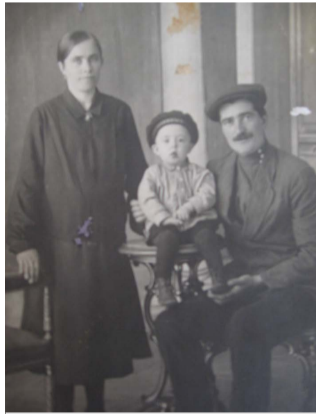
Родители с братом до войны.