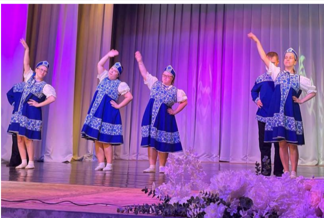
Инклюзивный танцевальный коллектив из Арзамаса исполняет танец «Матушка».