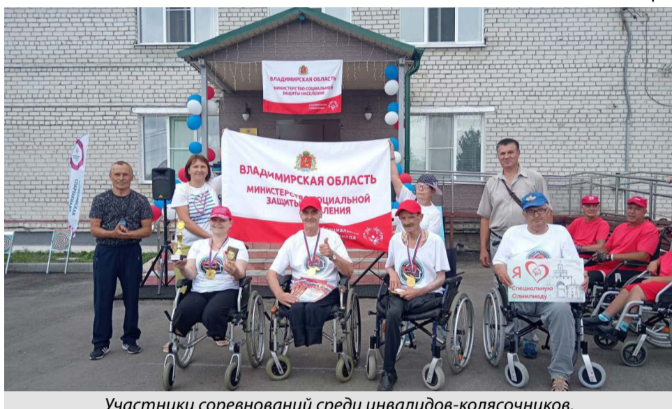
Участники соревнований среди инвалидов-колясочников.