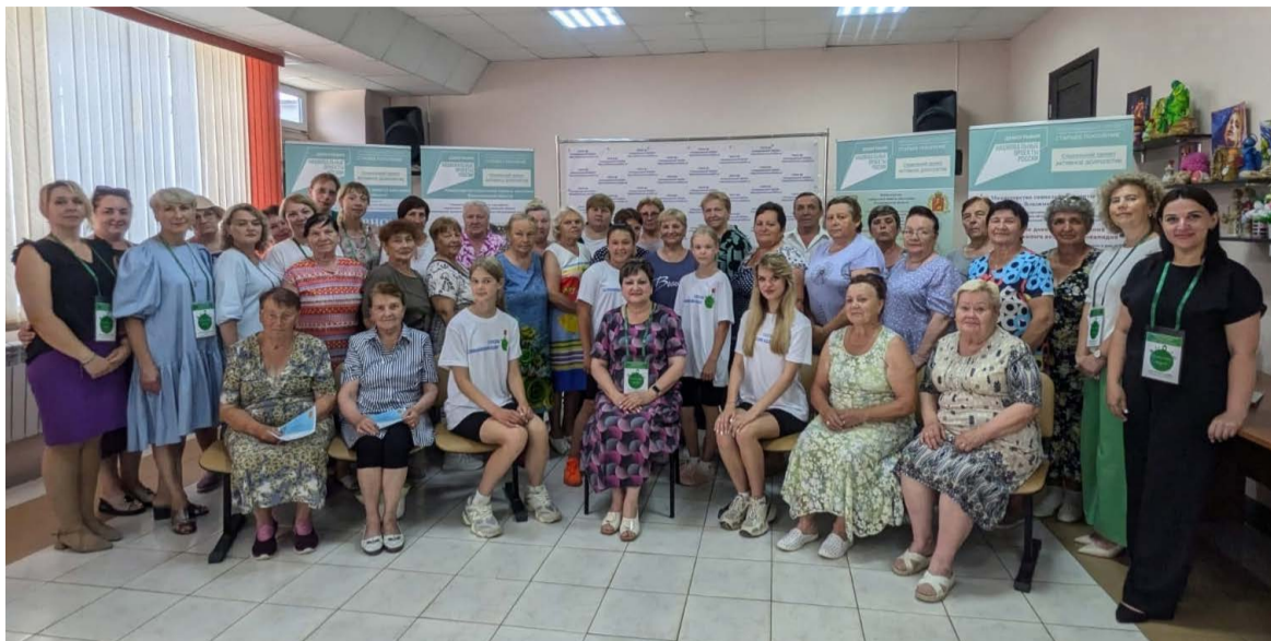
Участники первой площадки инновационного проекта «Источник жизни».