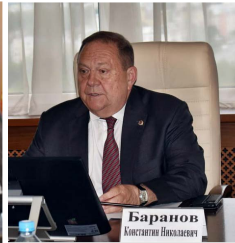
Константин Баранов, заместитель Губернатора Владимирской области.