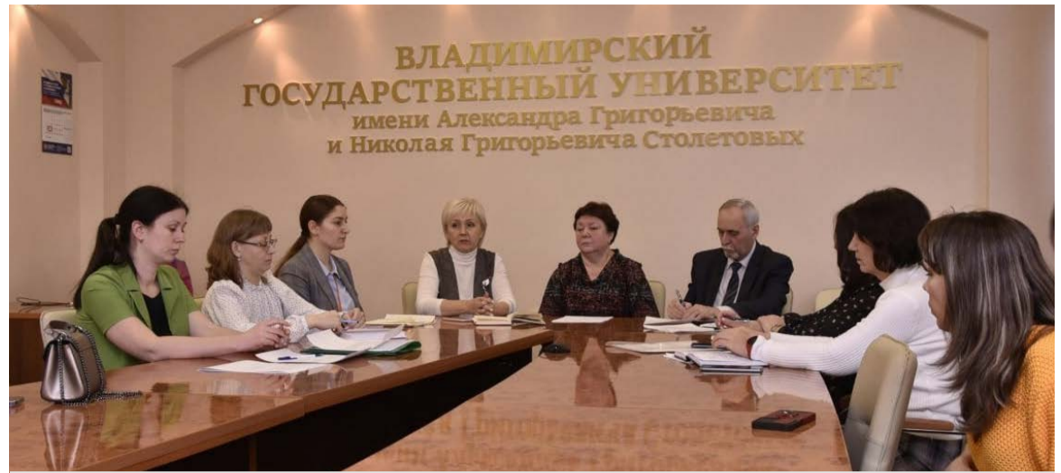
В работе группы приняли участие студенты РРУМЦ ИО ВлГУ и члены Владимирской городской организации ВОИ.