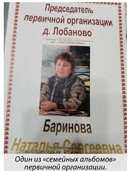
Один из «семейных альбомов» первичной организации.