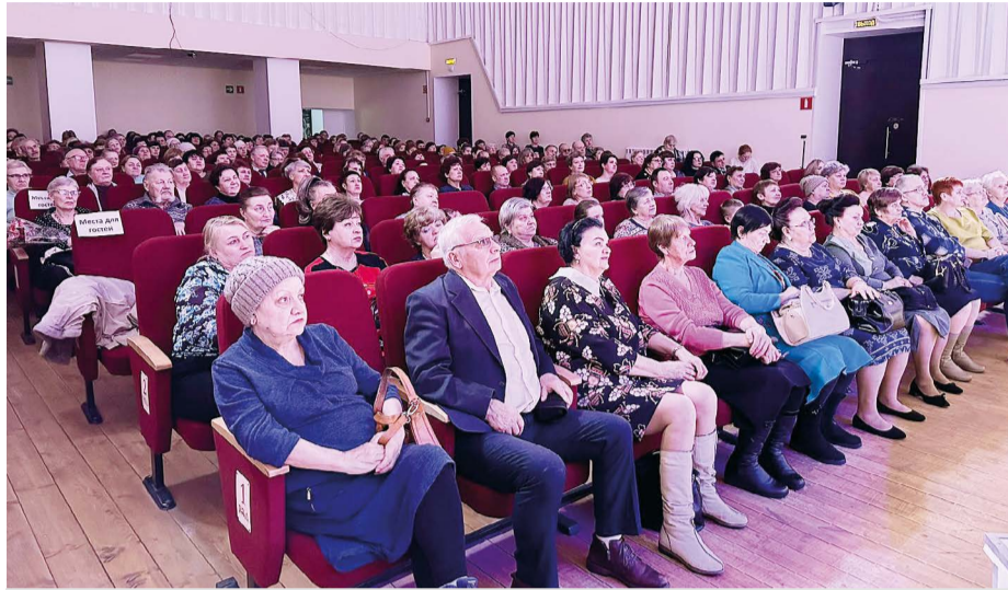
Селивановские зрители с восторгом приняли спектакль по творчеству А. Вертинского «За любовь благодарю...».