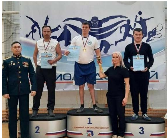
Моменты соревнований и награждения победителей на областном фестивале спорта в Коврове.