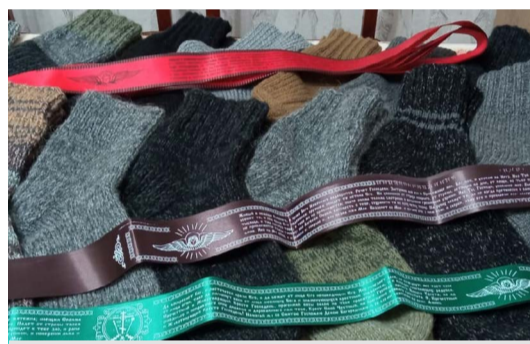
Вместе с носками солдаты получают и пояски с молитвами.