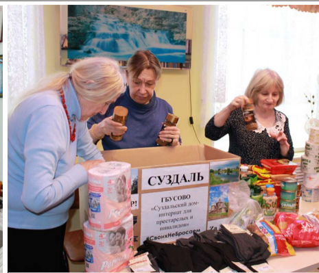
Посылку солдатам собирают в Суздальском доме-интернате для престарелых и инвалидов.