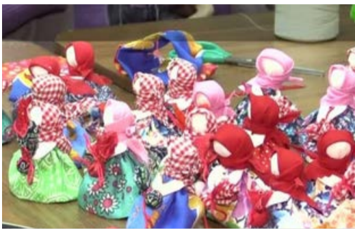
Эти куколки-обереги будут хранить наших солдат и напоминать о доме.