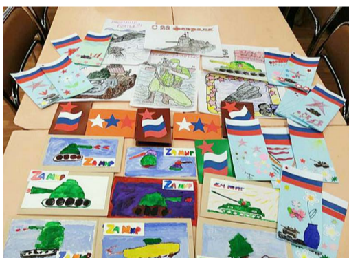
Вот такие открытки-поздравления сделали своими руками молодые ребята-инвалиды из АРДИ «СВЕТ».

АРДИ «СВЕТ». Молодые инвалиды из АРДИ «СВЕТ» нарисовали и подписали, сделанные своими руками открытки защитникам Отечества, в которых поздравляют их с праздником. Открытки очень трогательные, как и поздравления в них. А еще ребята с инвалидностью, участники образцового театра «Дружбы и добра особенных детей и молодых людей» собрали во время новогодних и рождественских выступлений средства, на которые были приобретены домкрат и автомобильные ключи для ремонта автомобилей. Все это уже отправлено бойцам в зону СВО.