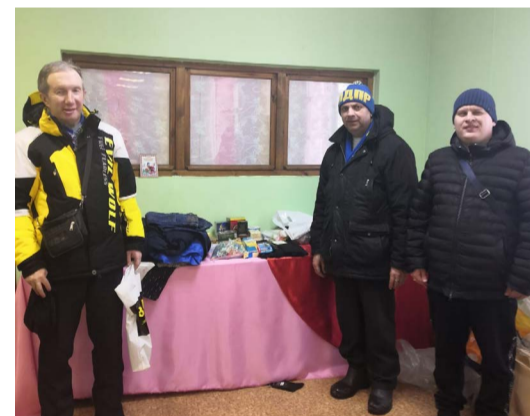
В гуманитарной акции смогли принять участие все желающие члены Ковровской организации ВОИ.