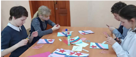
К изготовлению открыток ребята подошли ответственно.

г. МЕЛЕНКИ. В Меленковском районе к 23 февраля открытки-письма для бойцов в зоне СВО изготовили учащиеся специальной (коррекционной) общеобразовательной школы-интерната, состоящие в Меленковской районной организации ВОИ.