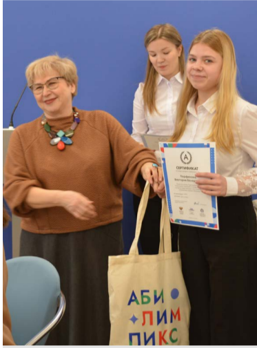
Награждение участников чемпионата по профмастерству.

Оно состоялось 2 февраля на базе Регионального центра движения «Абилимпикс» во Владимирской области. На заседании обсуждались вопросы занятости выпускников профессиональных образовательных организаций, участие в проектах президентской платформы «Россия – страна возможностей», а также вопросы по организации и проведению VII Регионального чемпионата «Абилимпикс» во Владимирской области, который будет проходить с 24 по 28 апреля 2023 года.