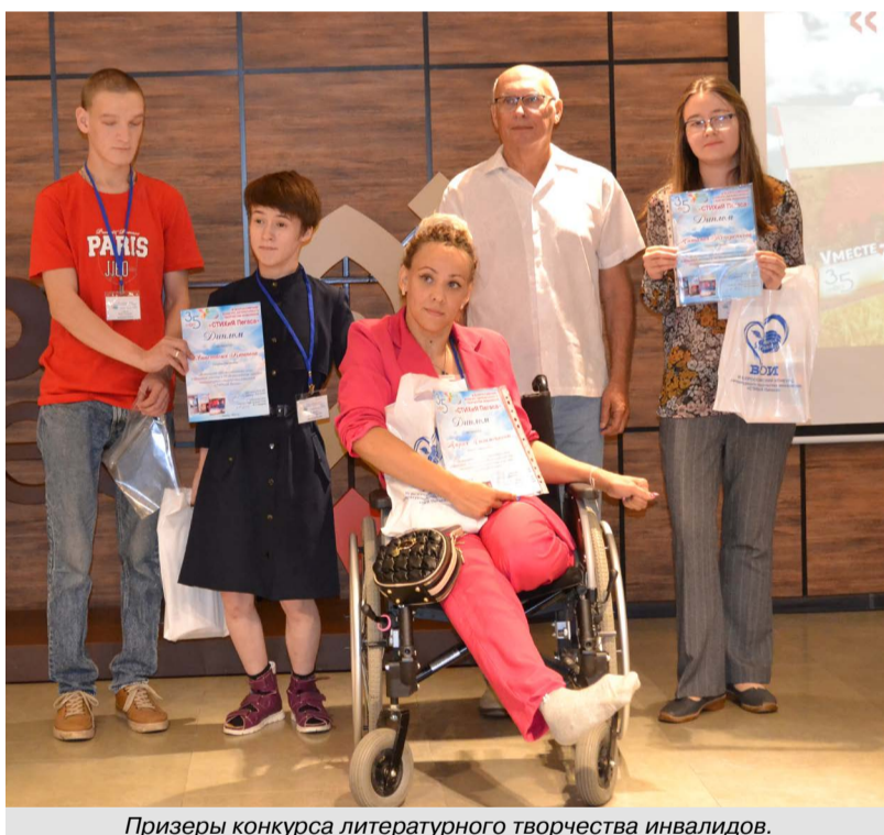
Призеры конкурса литературного творчества инвалидов.