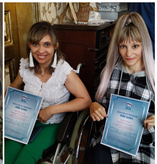
Награжденные члены отделения.