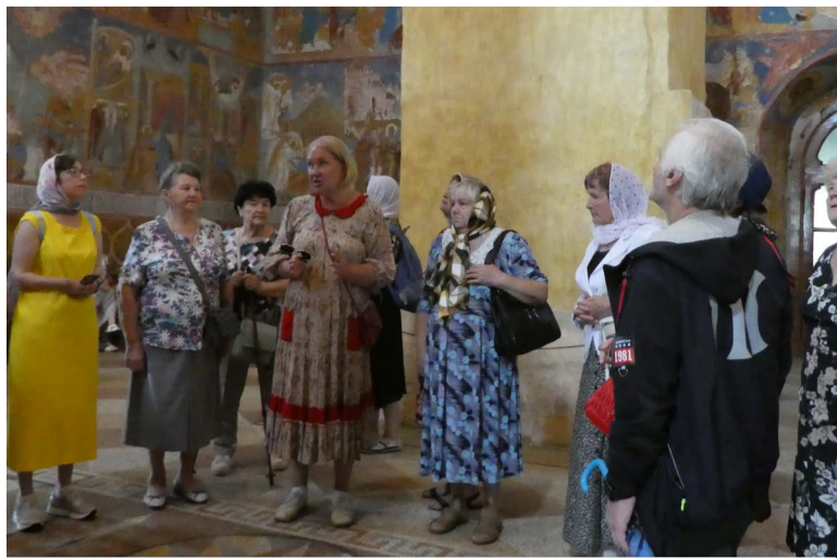
Члены Суздальского общества инвалидов на экскурсии.