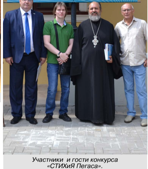
Участники и гости конкурса «СТИХИЯ ПЕГАСА».