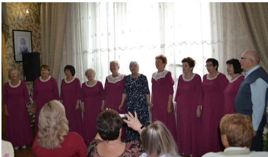
Музыкальное поздравление Гороховецкому отделению ВОО ВОИ.