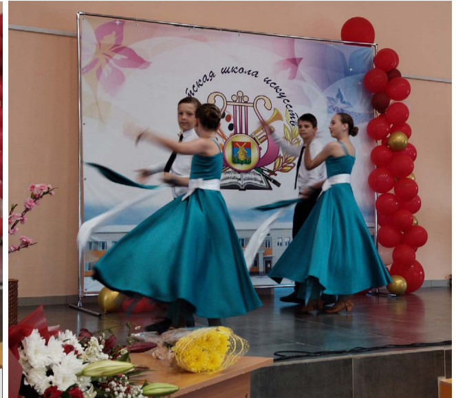
Музыкальные поздравления от учеников Школы искусств.