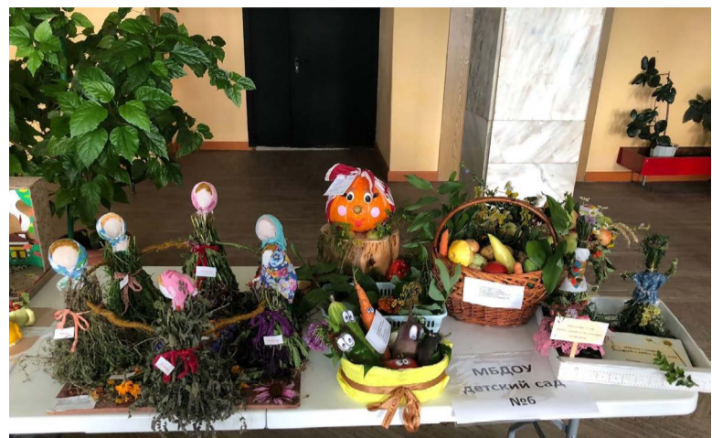
На выставочных столах были дары Юрьев-Польской земли.

Итоги выставки определяло жюри по нескольким номинациям: на самую богатую экспозицию; самую оригинальную поделку из овощей; самый большой фрукт и овощ; на лекарственные растения; оригинальные заготовки на зиму, самый красивый букет.