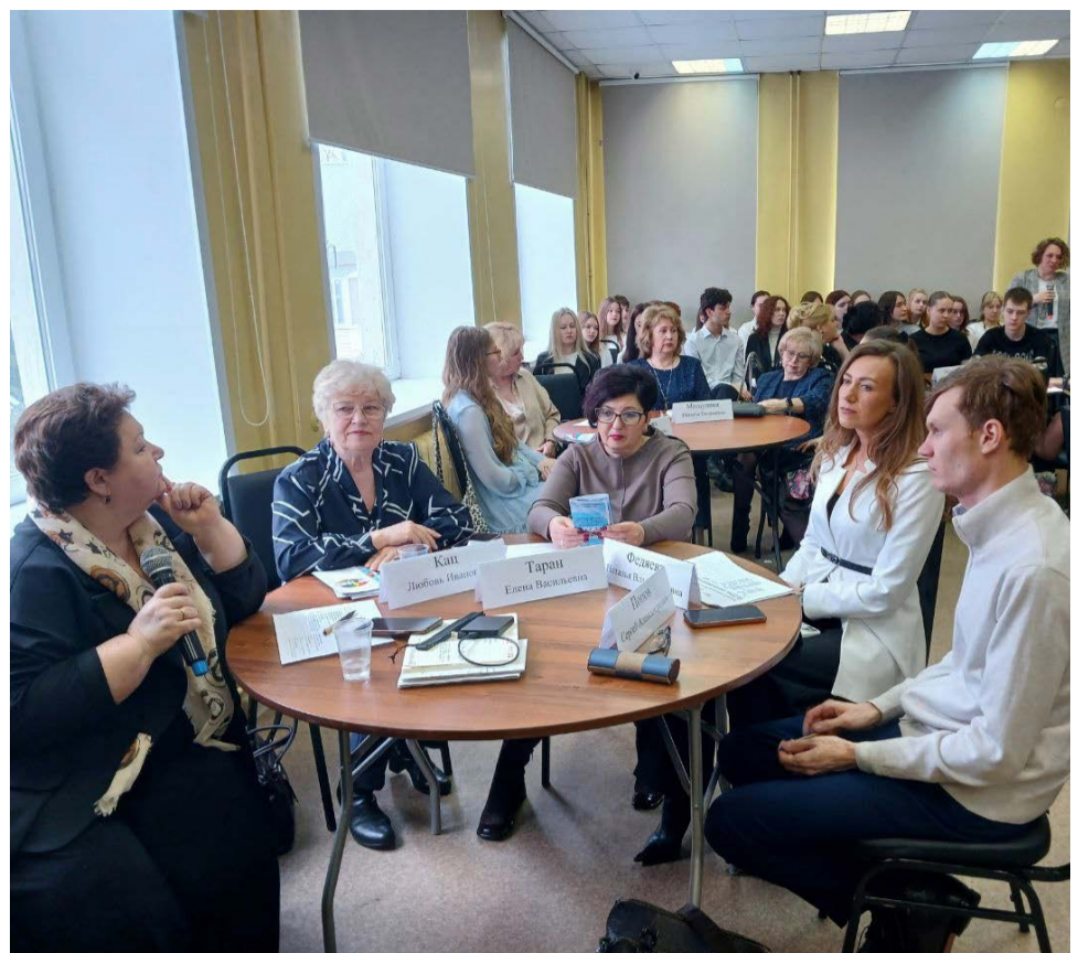
В конференции приняли участие партнеры проекта, которые обменялись опытом и подвели итоги совместной работы.

- Мы учим студентов не только делать манипуляции и соответствовать квалификационным требованиям, но и объясняем, что профессия медика требует эмпатии, - подчеркнула она. - Мы можем построить лифты, пандусы, раздать средства реабилитации, но важнее все-