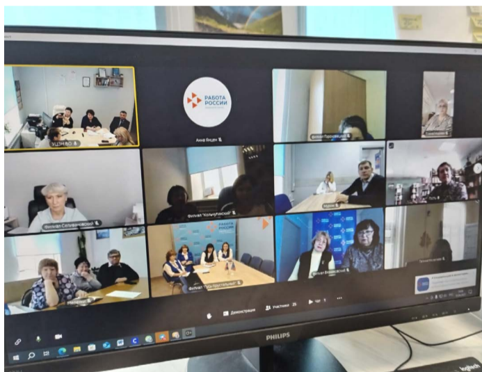
Встреча прошла в форме ВКС с участием местных организаций ВООО ВОИ.