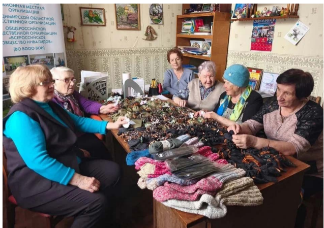
Члены Вязниковской организации вяжут носки и делают обереги для солдат.