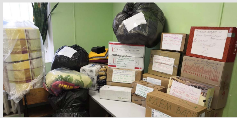
Очередная гуманитарная помощь для солдат СВО.