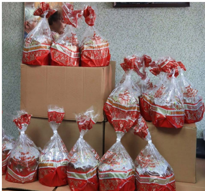
Кулич - главный подарок на Пасху.

Они приняли участие в крестном ходе, слушали церковные пасхальные песнопения, а потом разделили со всеми праздничную трапезу с неизменными символами Пасхи - освященными куличами и яйцами. Многие говорили, что именно здесь, в храме, они почувствовали и ощутили настоящий праздник Воскресения Христова, чувство любви и благодарности ко всем, кто творит добро и помогает ближним.