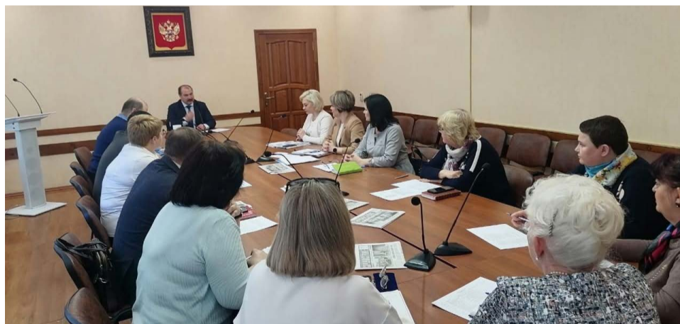
«Круглый стол» в администрации Вязниковского района.