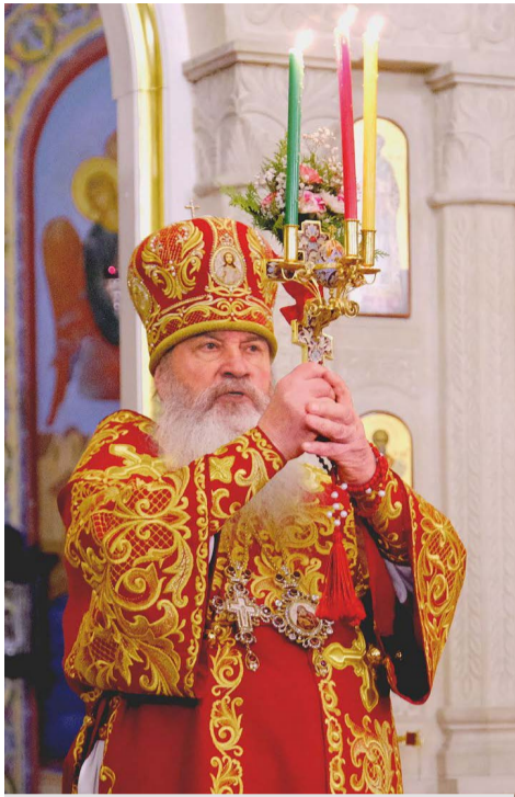
Митрополит Владимирский и Суздальский Тихон.

Во многих местных организациях общества инвалидов стало доброй традицией вручать каждому члену организации пасхальный кулич. Кто-то находит спонсоров (спасибо добрым людям), кто-то зарабатывает средства на своих предприятиях. Так было и в эти праздничные дни.