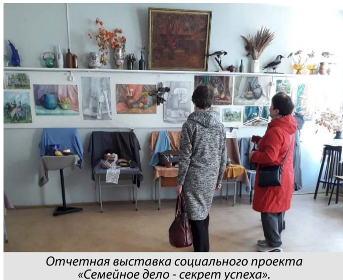
Отчетная выставка социального проекта «Семейное дело - секрет успеха».

г. МУРОМ. Муромское окружное отделение ВООО ВОИ было создано в 1988 году. Все эти годы организация занимается защитой прав инвалидов, организацией их отдыха и досуга, занятий творчеством. В 2013 году организацией была открыта студия прикладного творчества «Моя семья» для детей-инвалидов и молодых людей с инвалидностью, ограниченными возможностями здоровья. В 2018 году студия прикладного творчества «Моя семья» стала студией творчества. Кроме прикладного творчества появились кружки танца, вокала, сценического мастерства. Это стало возможным благодаря средствам государственной поддержки, выделенным окружному отделению общества инвалидов Фондом Президентских грантов.