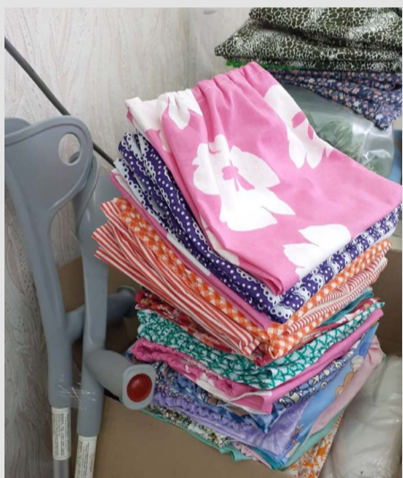
Очередная партия гуманитарной помощи - постельное и нательное белье.

Спасибо всем неравнодушным людям, которые помогают бойцам СВО. А судя по информации с мест, посылки благотворительную помощь продолжают оказывать почти все организации ВОИ в разных территориях региона.