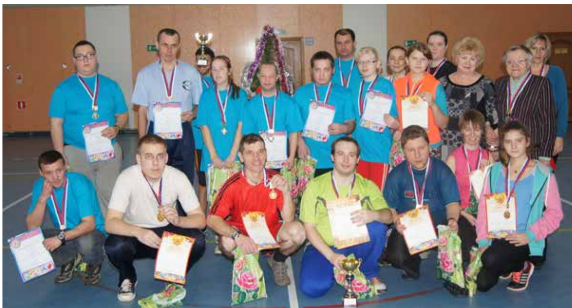
Участники спортивно-оздоровительного фестиваля.

В Греции гости, приглашенные на Новый год, захватывают с собой большой камень и бро-