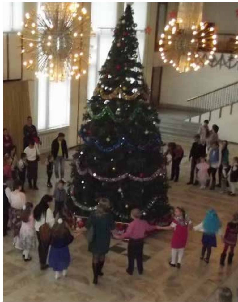
Хоровод вокруг новогодней елки.

- Конечно! Если только нет противопоказаний лечащего врача. У нас есть немало групп, которые работают в рамках инклюзивного образования. Например, в компьютерном классе. Есть и другие примеры. В том числе у нас занимаются дети из интерната для слабослышащих... Есть много других интернатов, которые к нам приезжают в га-