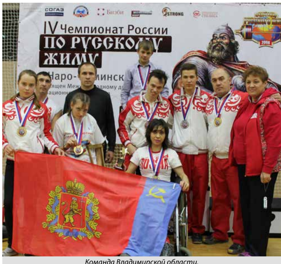
Команда Владимирской области.