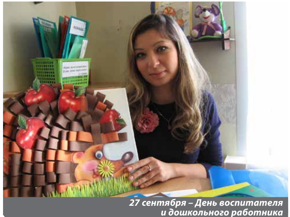
27 сентября – День воспитателя и дошкольного работника