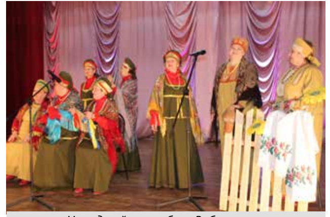
Народный ансамбль «Рябинушка» Муромцевского СДК.