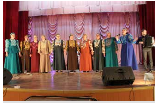
Народный ансамбль «Бабье лето» из Судогодского района.