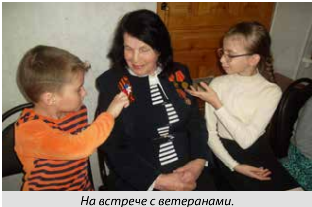
На встрече с ветеранами.