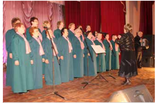
Хор ветеранов Судогодского районного ДК.