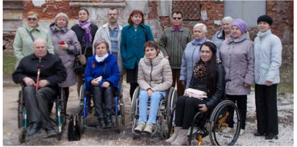
Участники встречи в музее-усадьбе Храповицкого.

Изрядно проголодавшись и хорошо нагуляв аппетит мы посетили местное кафе. Спасибо сотрудникам кафе, которые с душой относятся к своей работе