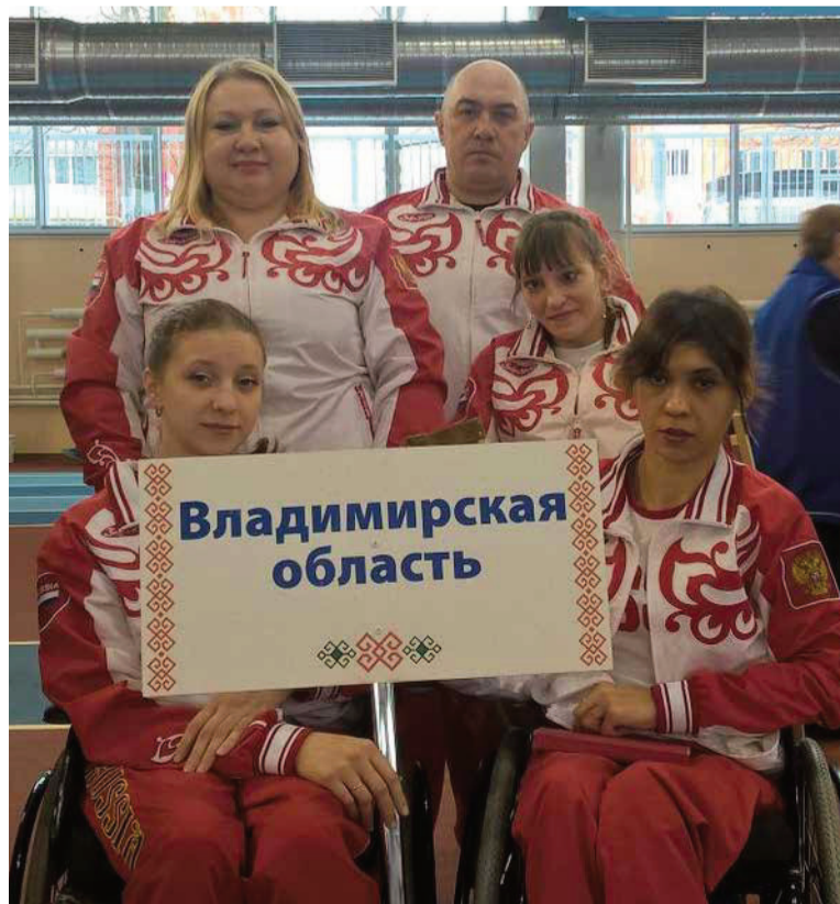
Сборная Владимирской области.