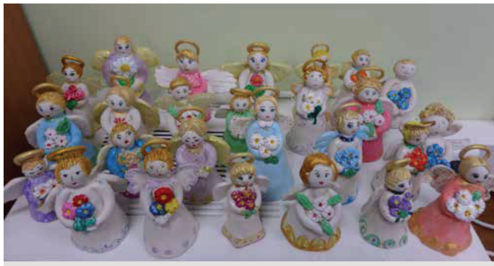
Керамические ангелочки, которые изготавливают участники проекта.