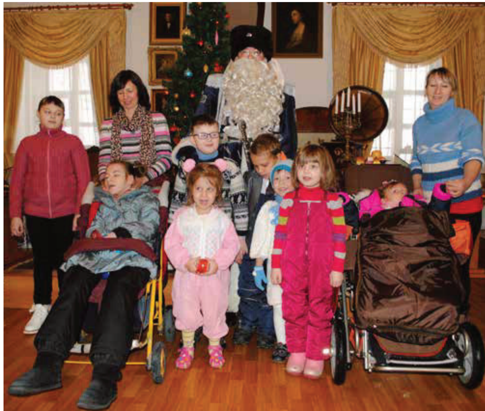
Во время посещения музея-заповедника «Александровская слобода».

С 2016 года музей начал сотрудничество еще с одним специфическим социальным учреждением города Александра - Центром помощи семье и детям. Самая первая акция, в которой приняли участие детишки-инвалиды из этого центра, – встреча с Всемирным Казачьим Дедом Морозом, который с недавних пор проживает в городе Гатчина Ленинградской области. Придумал этот образ и воплотил в жизнь потомственный казак (по линии отца — запорожский, по линии матери — оренбургский казак), казачий полковник Балтийского