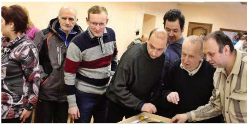
В новом досуговом центре в Коврове.