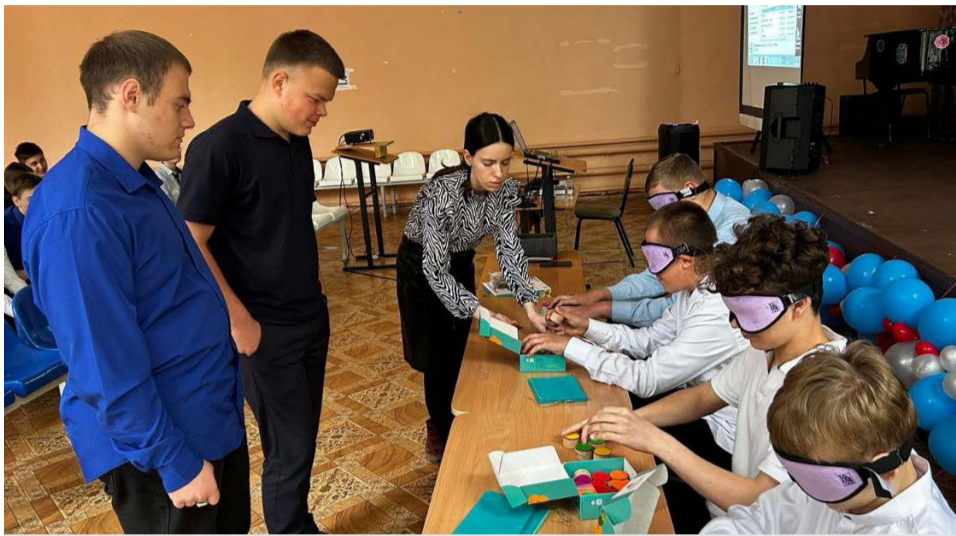
В школе № 11 г. Владимира давно работают по инклюзивным программам.

Одним из партнеров проекта «Инклюзивная среда – дружелюбная среда», который поддержан Фондом президентских грантов, является владимирская общеобразовательная школа №11. Здесь вместе с обычными ребятами учатся около 200 детей с особенностями развития и инвалидностью.