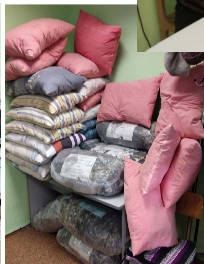
Все это отправляется в качестве гуманитарной помощи в зону СВО.