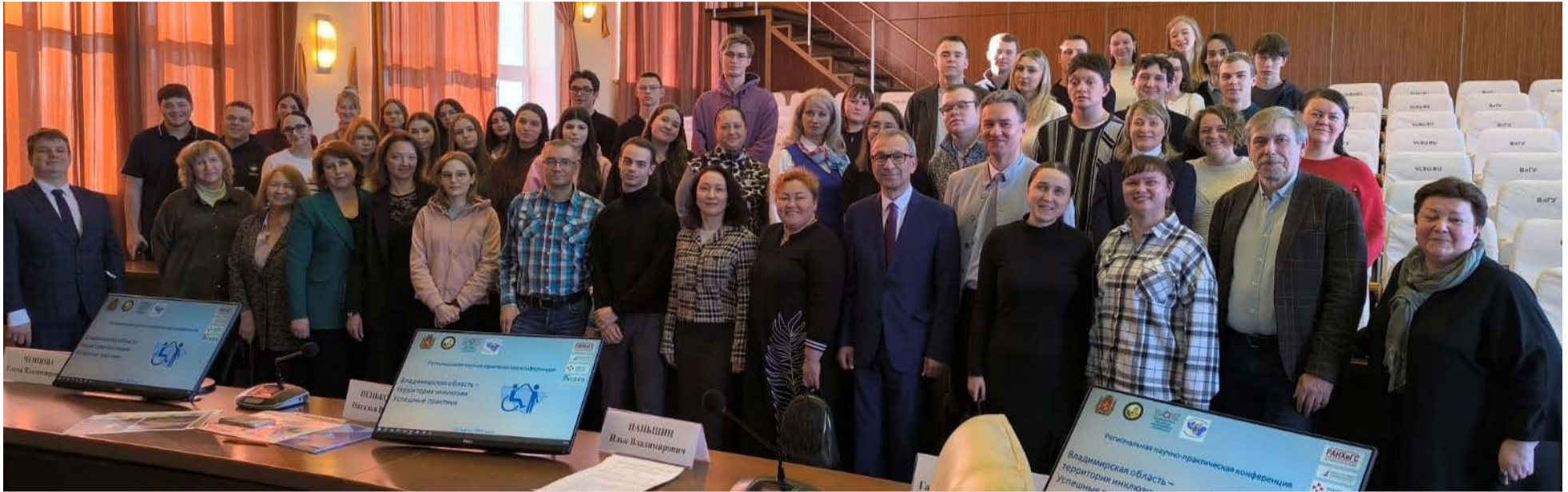
Участники научно-практической конференции «Владимирская область - территория инклюзии. Успешные практики».