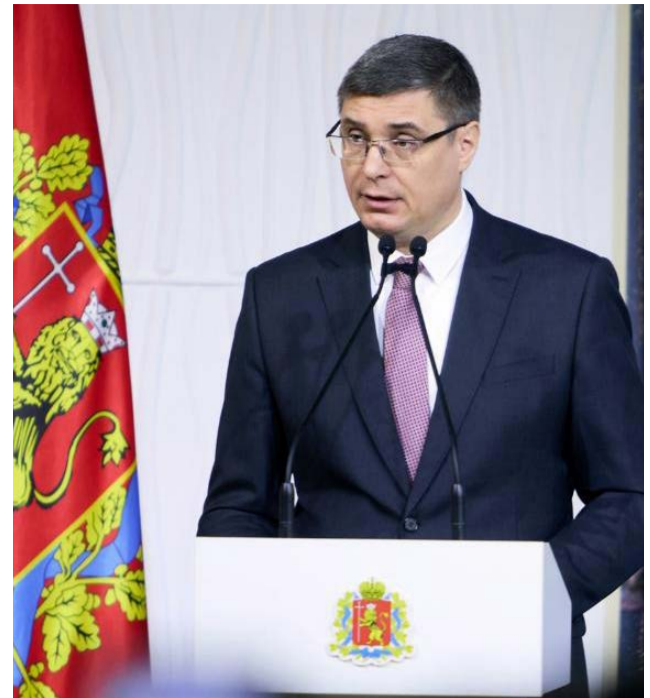
Губернатор Владимирской области Александр Авдеев.

Два года назад область перешагнула 100-миллиардную планку в доходах и расходах своего бюджета. В 2024 году удалось закрепить позитивную тенденцию: объём региональной казны достиг 116,6 млрд рублей. По сравнению с 2022 годом рост собственных доходов составил без малого 24 млрд рублей, или 36 процентов. Такая динамика позволяет чётко следовать ключевым аспектам социально-экономи-