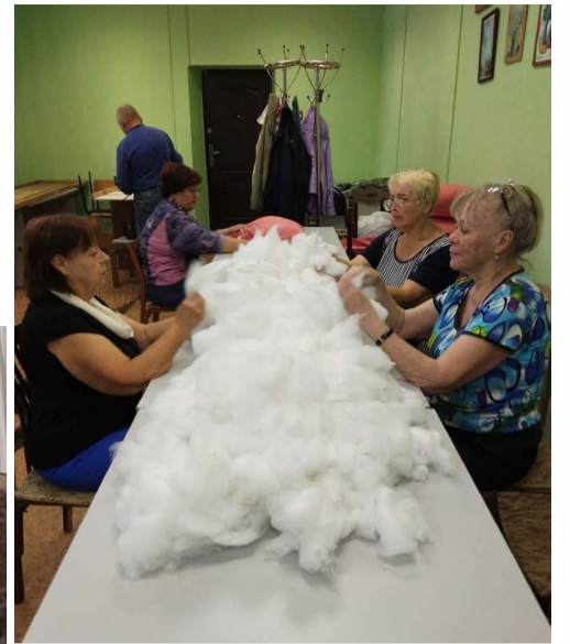
У дружного коллектива любая работа спорится.